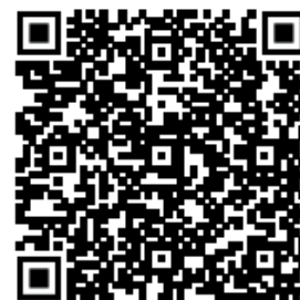
Abbildung 1: QR-Code zur Handreichung

Es ist möglich, dass nicht die verantwortliche Lehrkraft, also der*die Initiator*in des Lehr-/Lernarrangements den Entwurf des Avatars übernimmt. Durch die niederschwellige Zugangsmöglichkeit durch die neue Technik ist es auch denkbar, dass Lernende selbst Pädagogische Agenten entwerfen. Hier können Erkenntnisse aus der Fachwissenschaft der Psychologie herangezogen und zu einem späteren Zeitpunkt für die Pädagogik verifiziert oder falsifiziert werden. Bredl et al. (2017, S. 9ff.) beschreiben, wie sich selbstständig erstellte Avatare positiv auf die Individuen auswirken können. So können die virtuellen Figuren z.B. mit Merkmalen versehen werden, die den Individuen selbst besonders wichtig sind (ebd.).